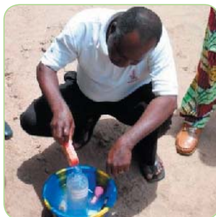
Formation Cotonou janvier 2009

Cette année la formation de 114 directeurs d'écoles a été assurée par l'équipe de formateurs béninois et par Caroline la formatrice Défi. Au cours de cette formation, des défis scientifiques sont proposés aux participants et ce matin là il s'agissait de la « bouteille blagueuse ». Les participants disposaient d'une bouteille en plastique percée, d'un bouchon et de la consigne suivante « Tu as une bouteille d'eau percée. Remplis-la d'eau. Evidemment, l'eau coule par le trou de la bouteille ! Comment arrêter l'écoulement sans boucher directement le