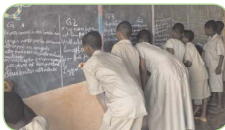
Ecole DALAVAE MONDZI

ne peut réussir que si les enfants s'expriment bien, alors nous avons fait un projet lecture, en demandant aux parents d'inscrire les enfants à la bibliothèque et nous y allons tous les vendredis après midi : chaque enfant doit lire et raconter ce qu'il a lu et nous les aidons » Il est nécessaire d'encourager ces initiatives pour les qu'elles se diffusent dans tout le pays..